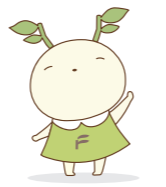
福島大学公式マスコットキャラクター めばえちゃん

復興牧場は研究・研修施設を設けた酪農研究の拠点としての基幹施設として期待されていることから、福島大学も研究面、人材育成の両面で関わっていきます。