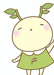
福島大学公式 マスコットキャラクター めばえちゃん